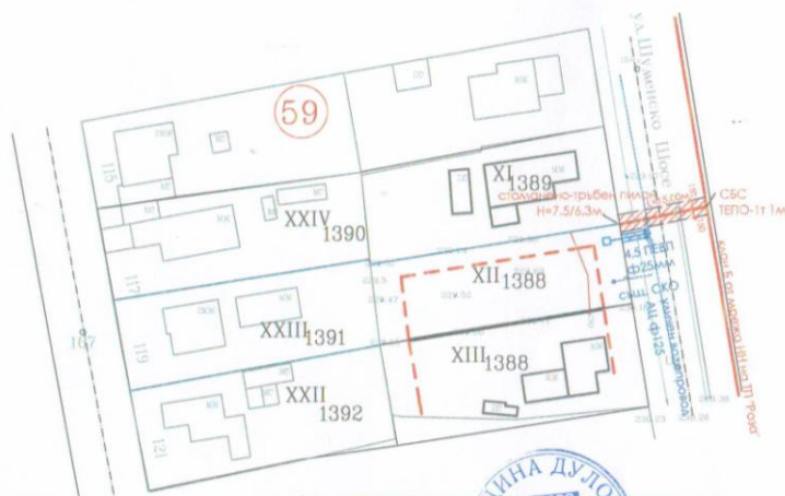
СХЕМА НА ИНЖЕНЕРНА ИНФРАСТРУКТУРА М 1:1000